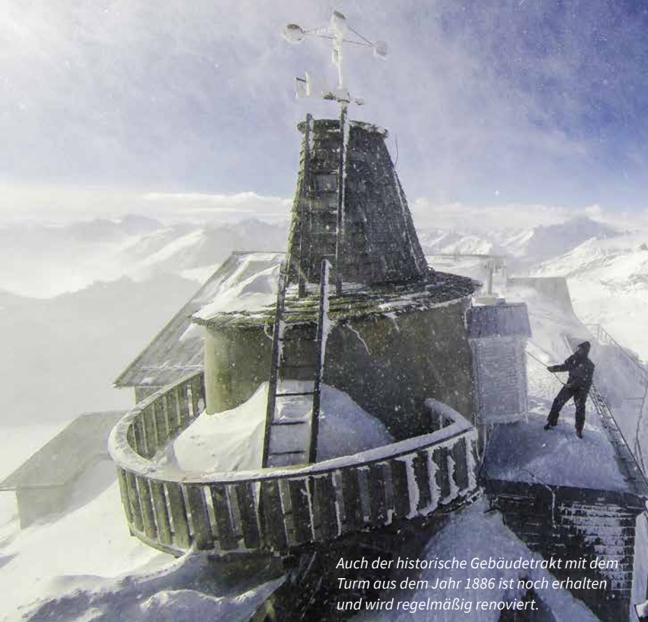
Auch der historische Gebäudetrakt mit dem Turm aus dem Jahr 1886 ist noch erhalten und wird regelmäßig renoviert.