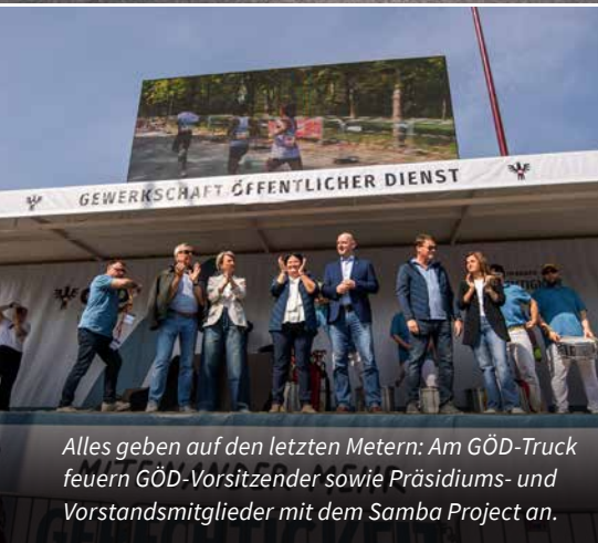
Alles geben auf den letzten Metern: Am GÖD-Truck feiern GÖD-Vorsitzender sowie Präsidiums- und Vorstandsmitglieder mit dem Samba Project an.