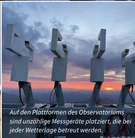
Auf den Plattformen des Observatoriums sind unzählige Messgeräte platziert, die bei jeder Wetterlage betreut werden.