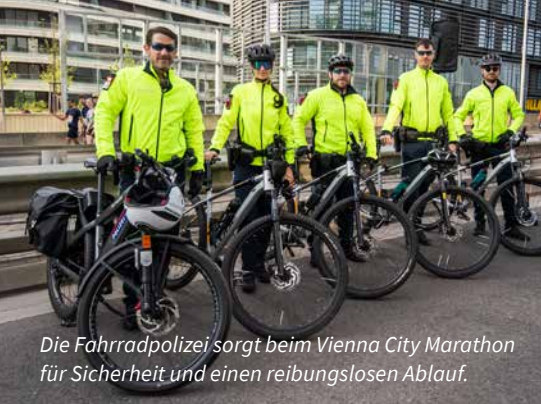
Die Fahrradpolizei sorgt beim Vienna City Marathon für Sicherheit und einen reibungslosen Ablauf.