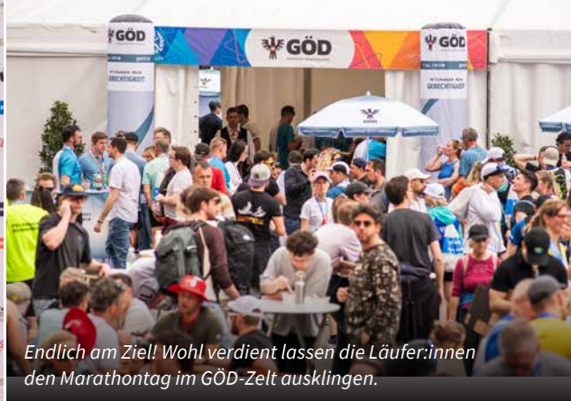
Endlich am Ziel! Wohl verdient lassen die Läufer:innen den Marthontag im GÖD-Zelt ausklingen.