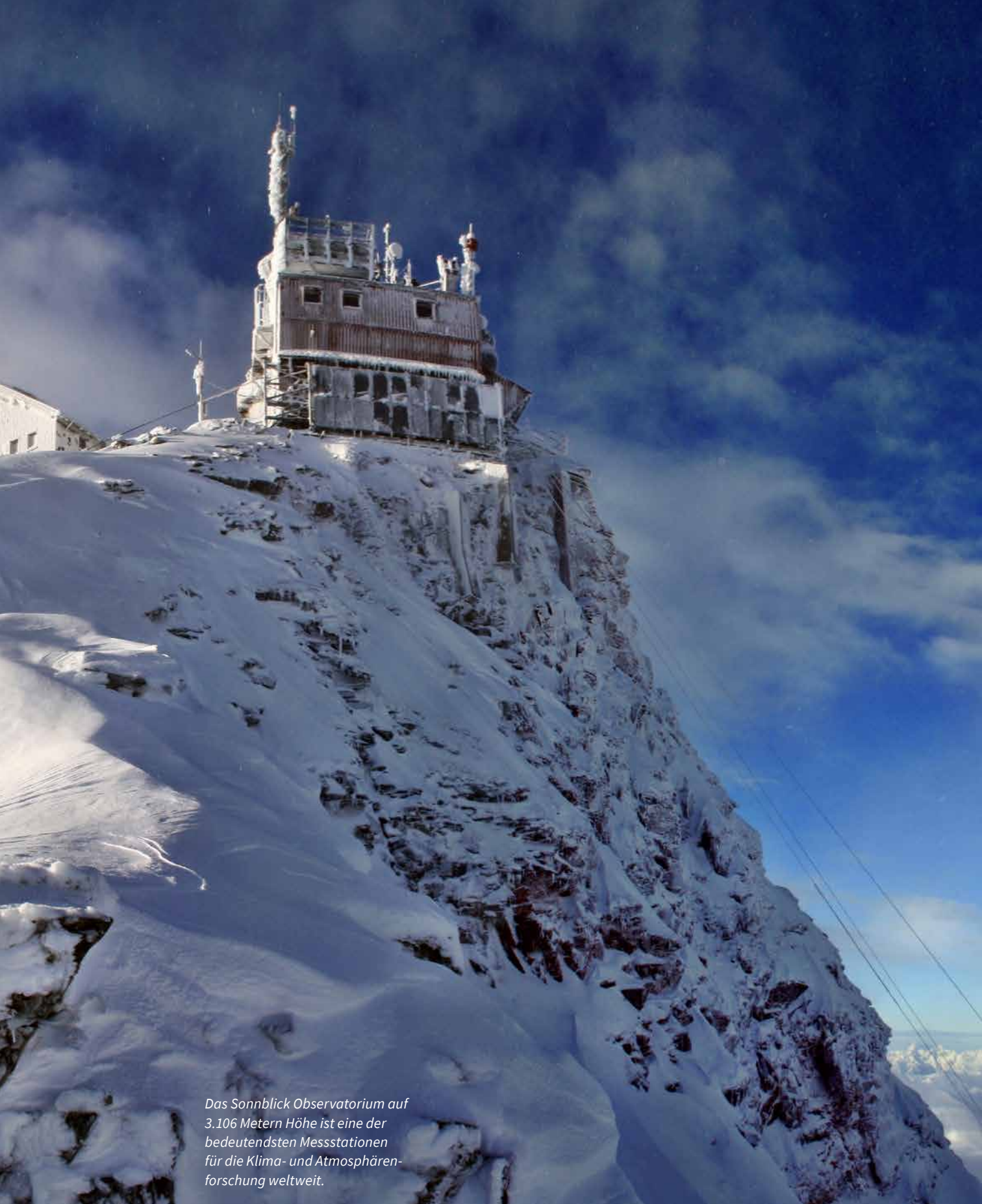
Das Sonnblick Observatorium auf 3.106 Metern Höhe ist eine der bedeutendsten Messstationen für die Klima- und Atmosphärenforschung weltweit.