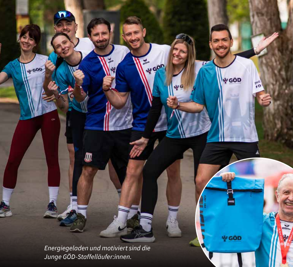
Energiegeladen und motiviert sind die Junge GÖD-Staffelläufer:innen.